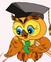
ГРАФИК ВСЕРОССИЙСКИХ КОНКУРСОВ, ОЛИМПИАД И ВИКТОРИН ДЛЯ ДЕТЕЙ РЦШиД "СОВЁНОК" МАЙ 2021 год