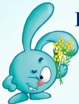
ГРАФИК ВСЕРОССИЙСКИХ КОНКУРСОВ, ОЛИМПИАД И ВИКТОРИН ДЛЯ ДЕТЕЙ РЦШ и Д "СОВЁНОК" НОЯБРЬ 2020 ГОД