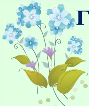
ГРАФИК ВСЕРОССИЙСКИХ КОНКУРСОВ, ОЛИМПИАД И ВИКТОРИН ДЛЯ ДЕТЕЙ РЦШиД "СОВЁНОК" МАРТ 2021 год