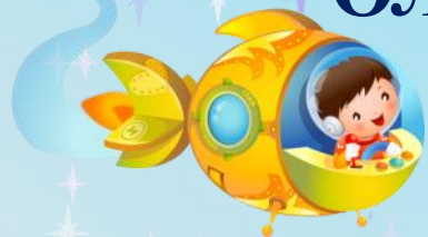
ГРАФИК ВСЕРОССИЙСКИХ КОНКУРСОВ, ОЛИМПИАД И ВИКТОРИН ДЛЯ ДЕТЕЙ РЦШ и Д "СОВЁНОК" АПРЕЛЬ 2021 год