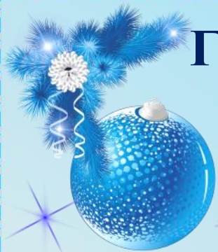
ГРАФИК ВСЕРОССИЙСКИХ КОНКУРСОВ, ОЛИМПИАД И ВИКТОРИН ДЛЯ ДЕТЕЙ РЦШ и Д "СОВЁНОК" ДЕКАБРЬ 2020 ГОД