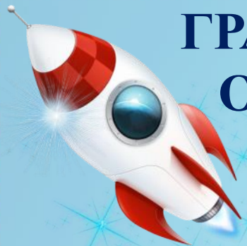
ГРАФИК ВСЕРОССИЙСКИХ КОНКУРСОВ, ОЛИМПИАД И ВИКТОРИН ДЛЯ ДЕТЕЙ РЦШиД "СОВЁНОК" ФЕВРАЛЬ 2021 год