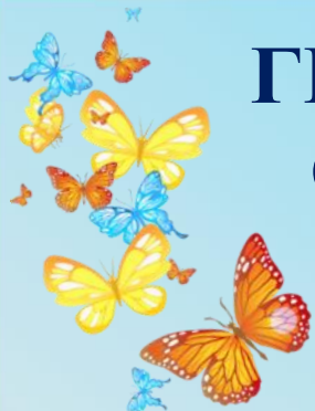
ГРАФИК ВСЕРОССИЙСКИХ КОНКУРСОВ, ОЛИМПИАД И ВИКТОРИН ДЛЯ ДЕТЕЙ РЦШИД "СОВЁНОК" СЕНТЯБРЬ 2020 год