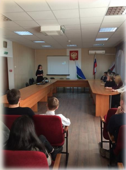
На встрече с представителями Администрации НГО.