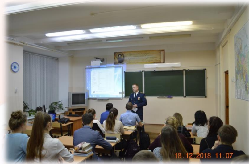
Встреча с представителями ФСИН Министерства юстиции РФ.