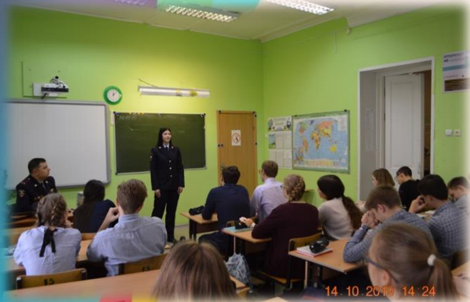
Встреча старшеклассников с представителями МВД.